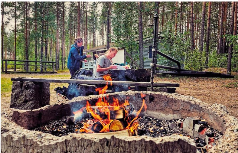
KYMENLAAKSON PARTIOPIIRI RY

Loppukesästä Kymenlaakson ja Hämeen partiopiirin yhteiseen ViMa-viikonloppuun Laitikkalaan osallistui kaksi Kymin ViMa-tiimiläistä. Syksyllä SP:n ViMa-koulutuksessa Helsingissä oli kaksi osallistujaa.